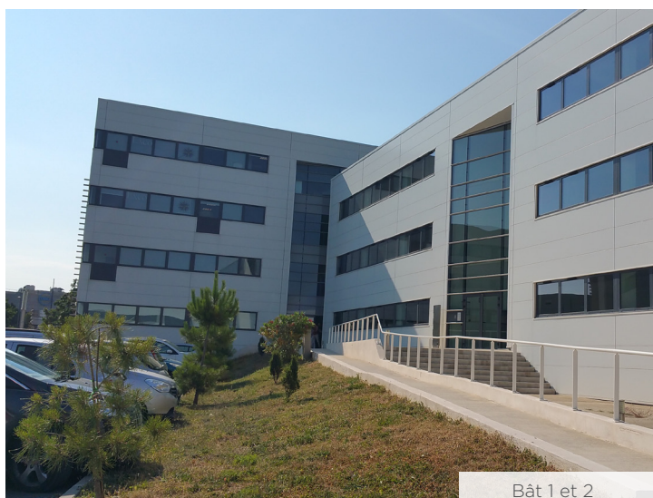
Bât 1 et 2